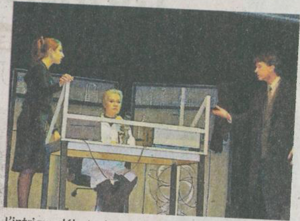
L'intrigue débute dans un laboratoire

La comédie Calune Opéra a enchanté le centre Hermès grâce aux qualités de la pianiste et des quatre protagonistes aussi doués pour la comédie que le chant. Dès le début, le public est propulsé dans une histoire scientifique avec une chef de laboratoire qui découvre une molécule exceptionnelle dans un vieux morceau de fromage.